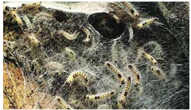
Chenilles au stade L2 sur le nid avant l'hivernage.

En cultures fruitières, pratiquement tous les insecticides appliqués en traitement pré- ou postfloral contre les arpeuteuses et les noctuelles sont également efficaces contre les larves du bombyx cul brun qui reprennent leur activité après l'hibernation. En été par contre, les jeunes larves fraîchement écloses échappent parfois aux programmes sélectifs appliqués contre les tordeuses. Même si les défoliations sont peu importantes, la