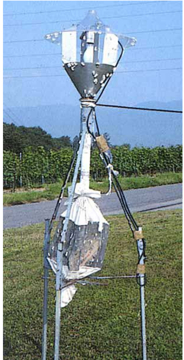
Lors de fortes pullulations, la quantité de papillons est telle que de nombreux individus sont encore visibles le matin autour du piège lumineux.